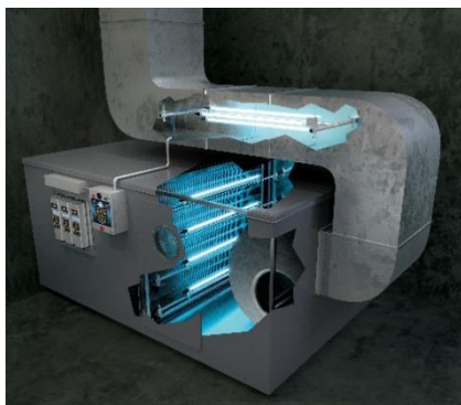
Дезінфекція радіатора та потоку повітря