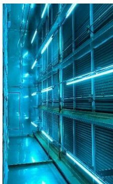
Дезінфекція охолоджувача повітря

Для отримання додаткової інформації про системи Fresh-AireUV або для обговорення конкретної програми звертайтеся до нас +48 533 974 371 або e-mail : biuro@freshaireuv.eu