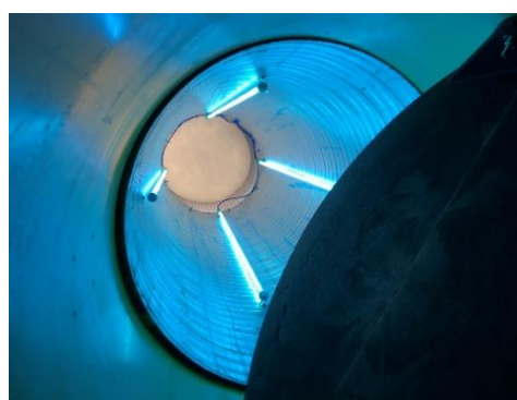
Дезінфекція повітря з рекуперацією тепла