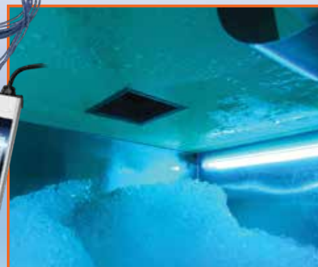
System lamp 32" dostępny dla większych kostkarek do lodu