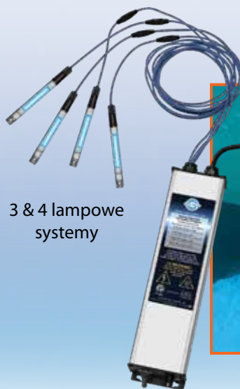
3 & 4 lampowe systemy