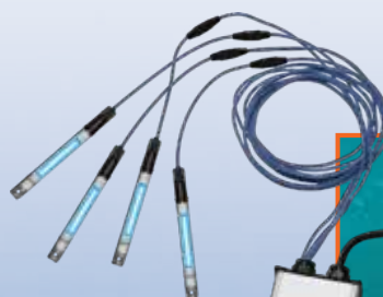
3 & 4 lampowe systemy