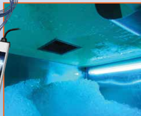
System lamp 32" dostępny dla większych kostek do lodu