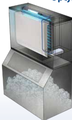
A. Nad parownikiem